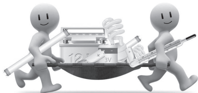
ГРАФИК ПРИЕМА ОПАСНЫХ ОТХОДОВ НАПЕРВОЕ ПОЛУГОДИЕ 2015 ГОДА

п.Ушково, ул. Советская, д. 10 – 25.04 с 13.30 до 14.30, 16.06 с 19.30 до 20.30