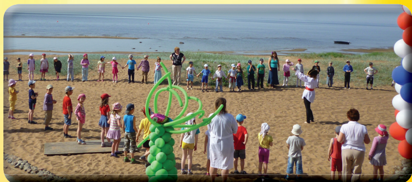
1 июня Праздник на пляже, посвященный Дню защиты детей.