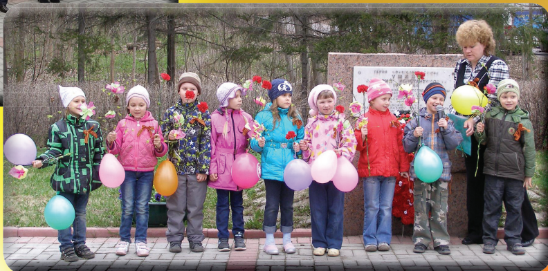
9 мая Торжественный митинг у мемориала Герою Советского Союза Ушкову Д.К.