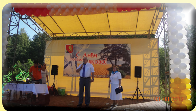
3 августа День поселка Ушково на площадке со сценой на улице Тюрисевская