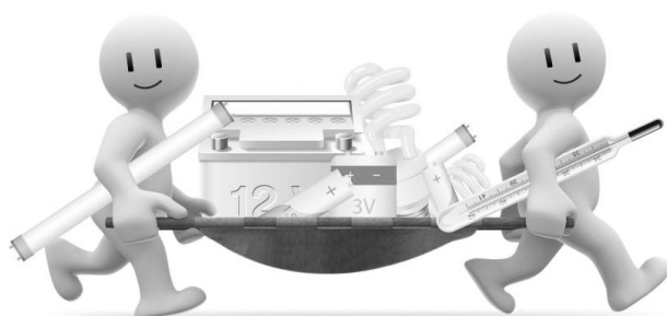
ГРАФИК ПРИЕМА ОПАСНЫХ ОТХОДОВ НА ПЕРВОЕ ПОЛУГОДИЕ 2013 ГОДА